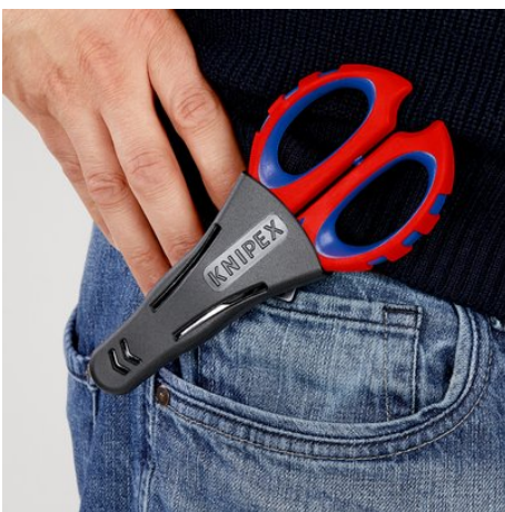
!Sicher verstaut und immer griffbereit!

A műszaki változtatások és tévedések jogát fenntartjuk