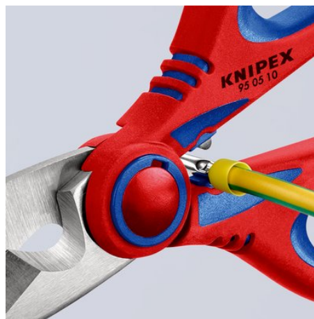
Gyors, egyszerű krimpelés